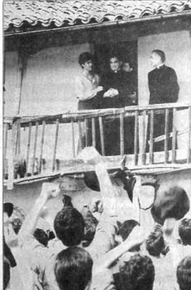
SAN JUAN BOSCO , mientras era proclamado "Padre bondadoso" por la juventud en uno de sus momentos que el recibía con su corazón a los jóvenes pobres y abandonados.

Así los ve Don Bosco: "... ¡Cuántos pobres muchachos abandonados, vagabundeando cada día descalzos, sucios, mendigos, por las callejas de nuestra ciudad!... Viven de limosna y se hacinan de noche en determinados lugares sin que nadie se preocupe piadosamente de sus cuerpos ni de