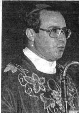
En estas fotos, el Cardenal Nicolás de Jesús López Rodríguez y parte de la directiva

Todas estas actividades serían concentradas en una sola fecha, como es el 31 de enero, día en que los salesianos conmemorarán el 104 aniversario de la