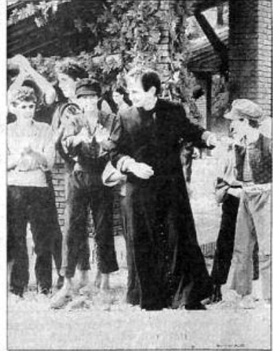
DON BOSCO , cuando seducía a los jóvenes con su lema de santificarlos: "Estar siempre alegre y no ofender a Dios".

sus almas... Crecen ignorantes de Dios, de la religión, de sus deberes morales. Son ladrones, blasfemos, obscenos: están dominados por toda clase de vicios, son capaces de la acción más recriminable... Muchos de ellos caen en manos de la justicia y van a parar a una prisión donde acaban de corromperse".