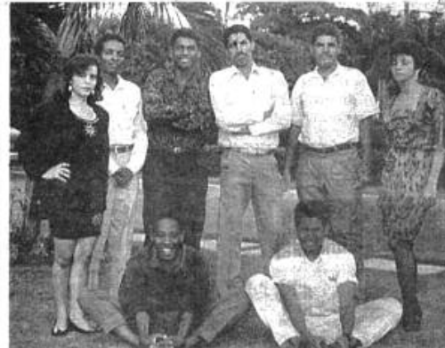
del Comité "Día de Don Bosco, Día de la Juventud".